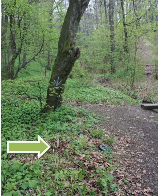
fot. 1. Lokalizacja nowej tablicy.

Pkt 1 – tablica mała (wymiana) - montaż przy ścieżce biegnącej do rezerwatu + likwidacja starej tablicy, zlokalizowanej przed szlabanem