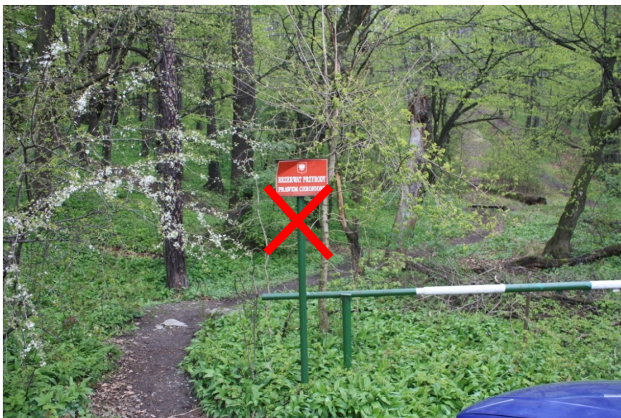
fot. 2. Usunięcie starej tablicy.